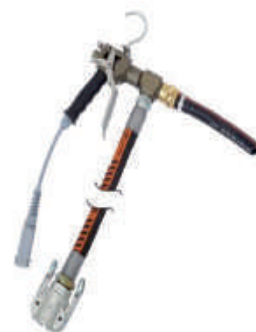
420058 Zargomat pro