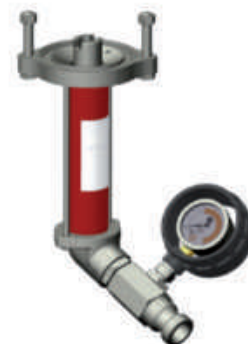
613021 B4-2 (rechtsdraaiend)