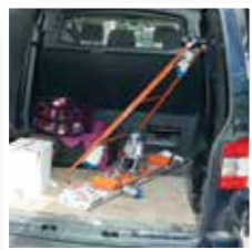
Eenvoudig mee te nemen.