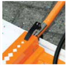
Makkelijk te monteren.