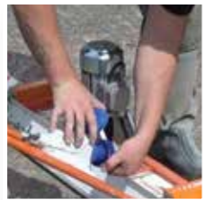
Economisch in gebruik.

Arbeidsvriendelijk systeem om ook in de toekomst traditionele cementdekvloeren te blijven maken. Rechtopstaand achter machine legt u alle dekvloeren vlak. Nadat de hoogtes en banden gezet zijn de specie uitvlakken en over de gestelde banen mechanisch afreien met de 'Airone' in de gewenste breedte van 200, 150 of 100 cm.